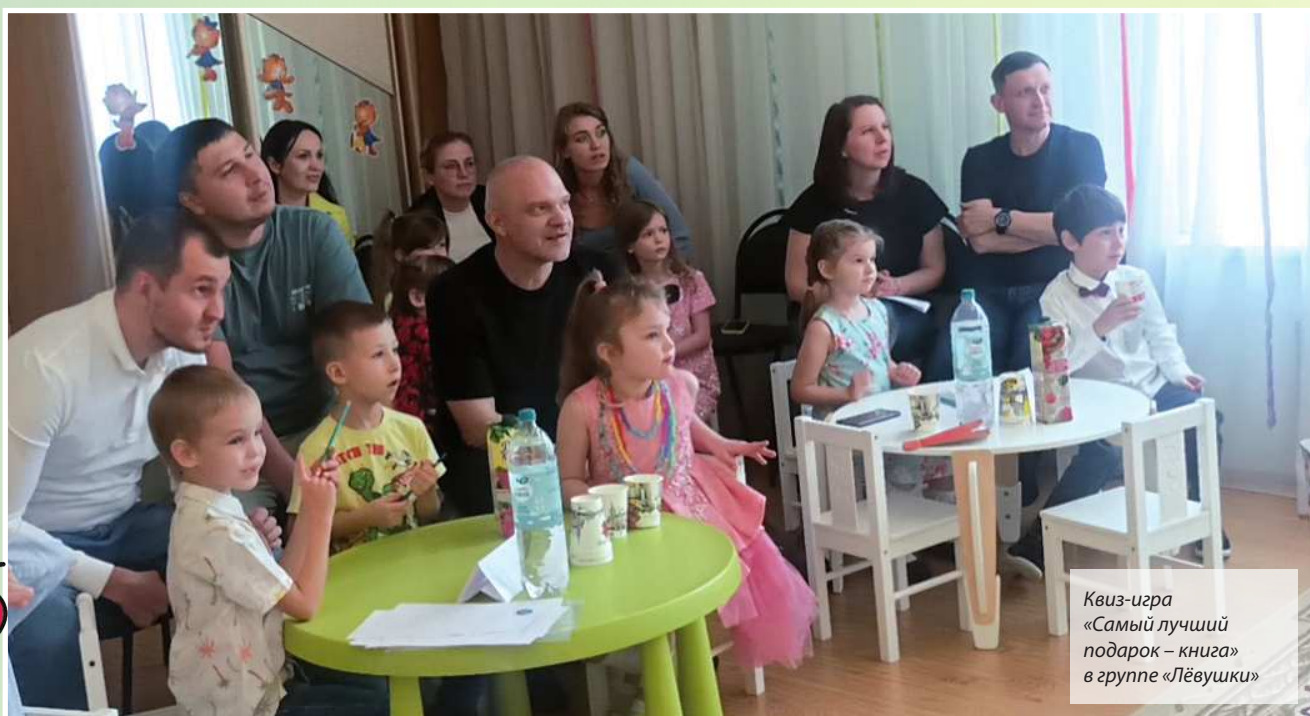
Квиз-игра «Самый лучший подарок – книга» в группе «Лёвушки»