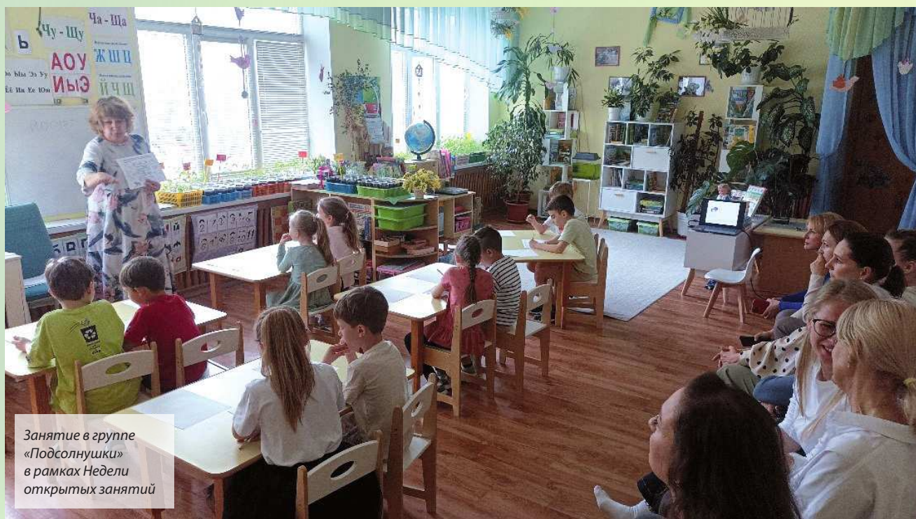
Занятие в группе «Подсолнушки» в рамках Недели открытых занятий

Очевиден положительный результат проделанной работы всего коллектива. Дети с успехом применяют новые знания и умения в повседневной деятельности.