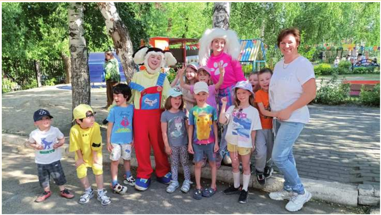
Первый день лета доставил детям радость и хорошее настроение. Они участвовали в празднике, посвященном Дню защиты детей