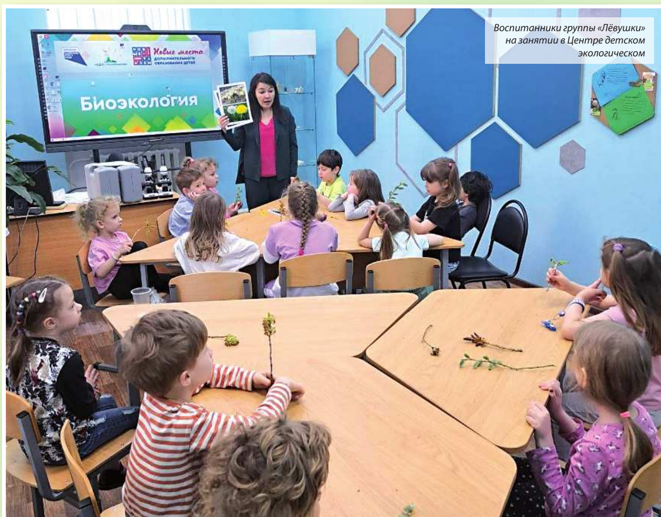
Воспитанники группы «Лёвушки» на занятии в Центре детском экологическом

Во-вторых, родители будут избавлены от нытья в духе «мне скучно», потому что ребенку всегда будет, чем заняться.